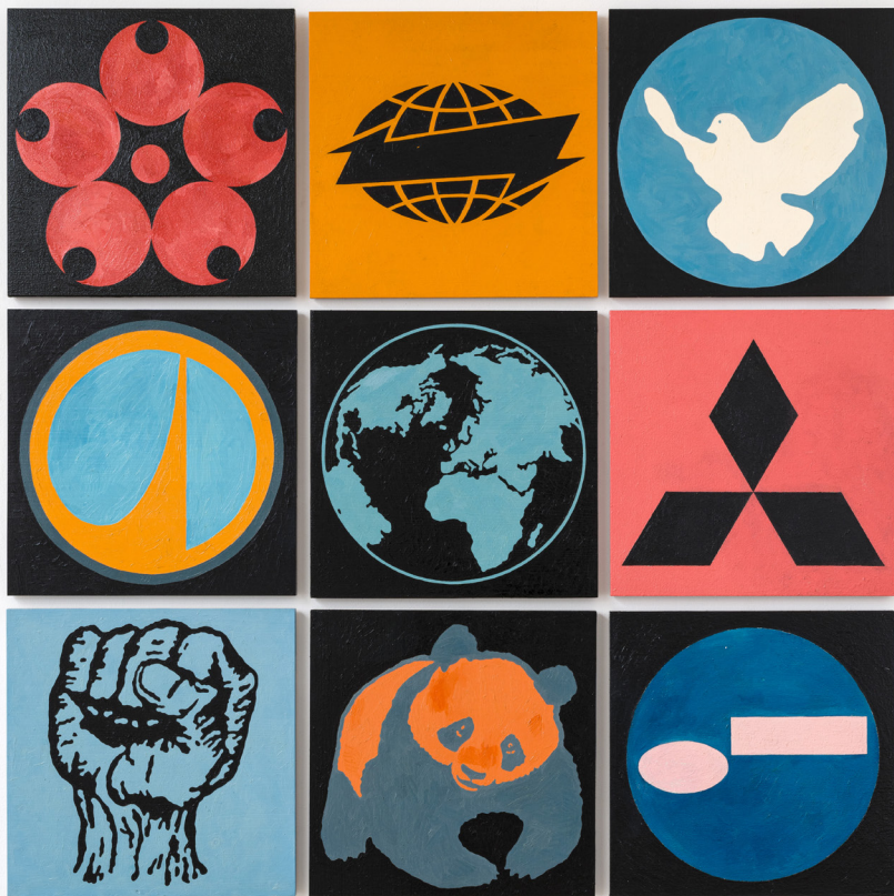
FRIDVALSZKI Márk: Logos, 2021, oil on plywood | olaj, rétegtelt lemez, 120x120 cm