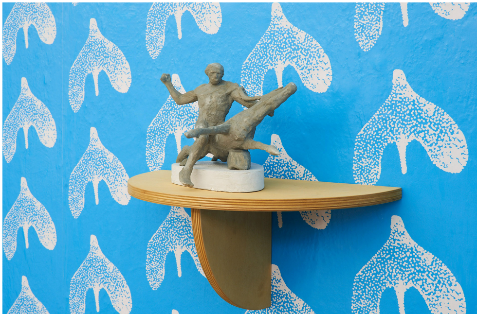
FRIDVALSZKI Márk: Triumph of the Mammals, 2021, 3D printing | 3D nyomtatás, 16x24x17 cm, Original Sculpture | Eredeti szobor: Antonín Širůček, Stag Hunter | Szarvasvadász, 1961

Sokót Gallery, Nowy Sącz; a D21 Kunstverein, Lipcse; a Kunsthalle Exnergasse, Bécs; a Kisterem Galéria, Budapest; a 34. Ljubljana Grafikai Biennále, MGLC; a Magyar Nemzeti Galéria; a Ludwig Múzeum, Budapest tárlataira.