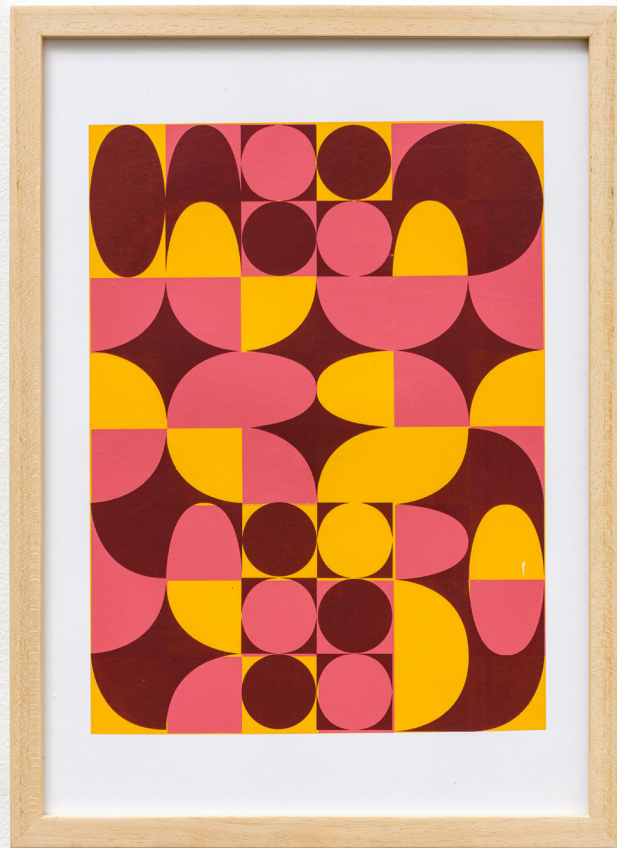
FRIDVALSZKI Márk: Modular Joy II, 2021, screen printing, paper | szitanyomat, papír, Ed.: 45 +3AP, 29,7×42 cm