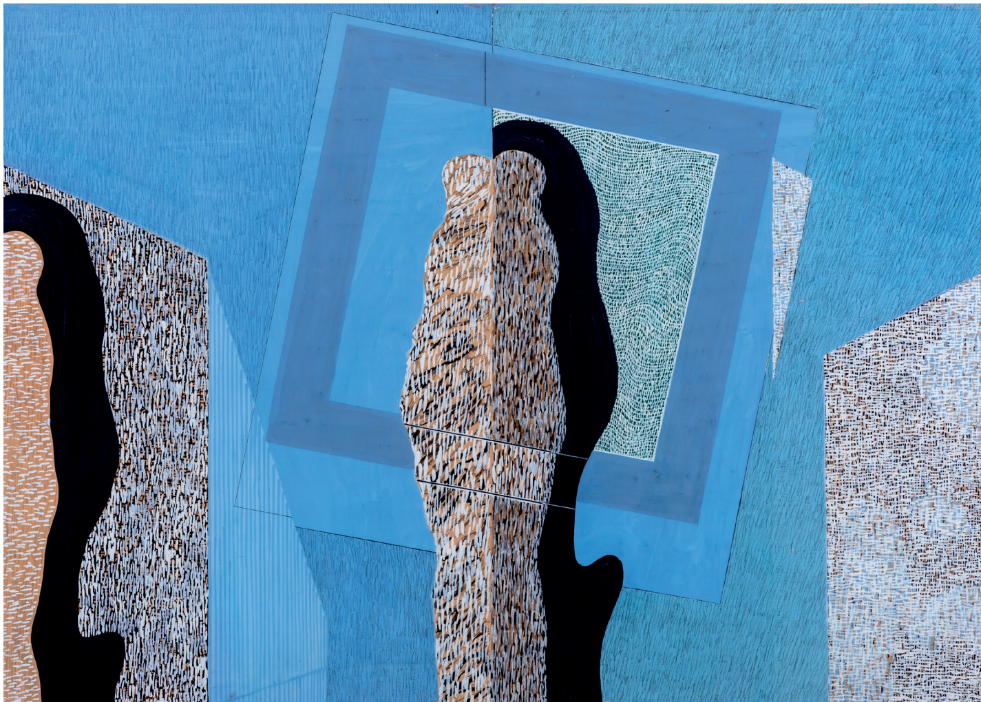
DEIM Pál: Csend I. | Silence I, 1968, papír, tempera | paper, tempera, 59 x 84 cm, Deim Pál hagyatéka | Pál Deim's estate