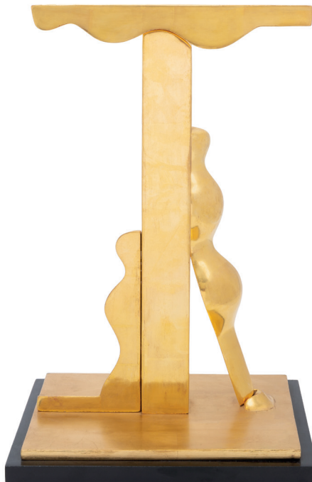
DEIM Pál: Golgota | Golgotha, 1989, aranyozott fa | gilded wood, 40 × 25 × 20,5 cm, Deim Pál hagyatéka | Pál Deim's estate

A művész születésének kilencvenedik évfordulója alkalmából megrendezésre kerülő kiállítás életművének friss szempontú áttekintésére vállalkozik. Az alkotói korszakok ismertetése mellett nagy hangsúlyt kap Deim Pál sajátos motívumhasználatának és absztrakciójának elemzése, valamint a téralakítás kérdésköre mind a festmények és plasztikák, mind a köztéri művek vonatkozásában. A tárlat és a hozzá kapcsolódó katalógus igyekszik kitérni életének és munkásságának legfontosabb állomásaira, hogy minél teljesebb képet alkosson művészi és emberi gondolkodásmódjáról.