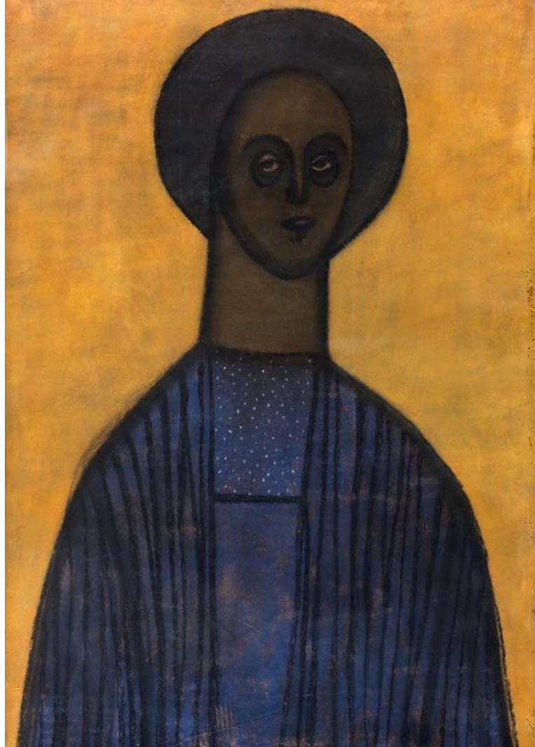
1936/31. | pasztell, papír | pastel on paper | FMC, Szentendre