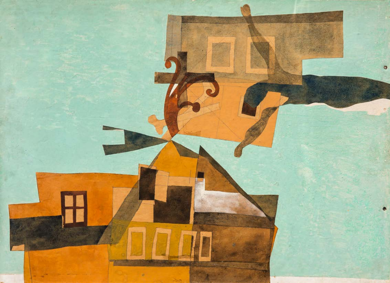
1937/28. | tempera, kollázs, karton | tempera, collage on cardboard | FMC, Szentendre