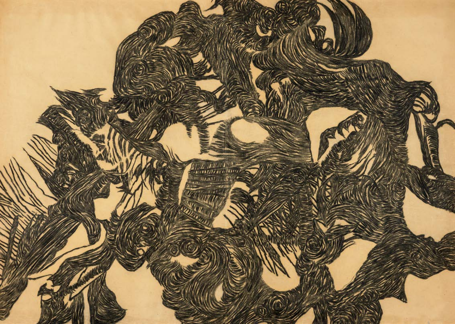
1940/24. | szén, papír | chalk on paper | FMC, Szentendre