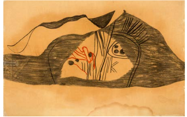
1939/5. | szén, pasztell, papír | chalk, pastel on paper | FMC, Szentendre

Though he died young, Lajos Vajda became the most important, most influential Hungarian artist of the 20 th century, thanks to a work that consciously drew on traditions, which it then revitalized with a progressive approach. Informed by a desire to create a world view, his oeuvre was marked by coherence throughout its progress from constructivism and surrealism, through transparent drawings of a completely individual tone, to the organic abstract works of his last years. A few questions are worth asking, however. What makes Vajda's art pioneering? Why did he become a 'prophet' for the progressive European School after his death? What legends surrounded him during his life and after his death? And why was his art destined to be ignored and misunderstood for decades? With the works of the