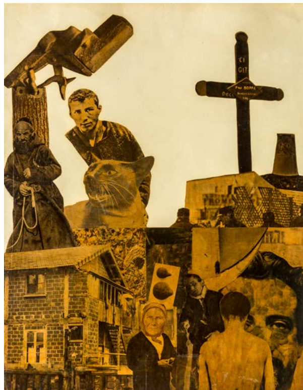
1930–33/14. | fotómontázs, papír | photomontage on paper | FMC, Szentendre

A fiatalon elhunyt Vajda Lajos felvállaltan a hagyományokból merítő, de azt progresszív szemlélettel megújító művészete kétségtelenül a 20. század legfontosabb, legnagyobb hatású alkotójává emelik őt. A konstruktívizmustól a szürrealizmuson át, a teljesen egyéni hangvételű transzparens rajzoktól az, élete utolsó éveiben kibontakozó organikus-absztrakt művekig bezárólag konzekvensen épülő munkásságán keresztül válik érzékelhetővé egy koherens, világképteremtő szándékot mutató életmű. Azonban felmerül a kérdés, miben áll, hogyan fogalmazható meg Vajda művészetének úttörő jellege, miért vált a progresszív szellemiségű Európai Iskola „prófétájává”, milyen legendák övezték életében, majd halála után is, és miért lett művészetének sorsa hosszú évtizedeken keresztül a mellözöttség