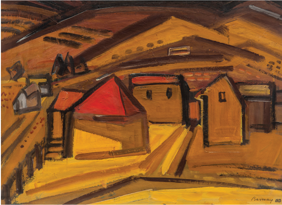
BARCSAY Jenő: Izbég (Szentendrei táj) Izbég (Szentendre Landscape) 1934 60 × 80 cm tempera, papír | tempera, paper

Barcsay Jenő képről képre kísérletezett a tér és a forma viszonyával, az arányok és a kép struktúrájával. A látvány precíz, aprólékos tanulmányozásával művészi témáinak fókuszába egyre inkább Szentendre városképének igéző részletei kerültek. Olajképein a kontúrok által felépített konstrukciót felváltotta a színfoltokból és mértani formákból való képszerkesztés. A kiállításon végigbarangolhatunk a ritmikus szerkesztőelv, a drámai színhasználat és az egyre határozottabb absztrakció szintézisére törekvő életművön.