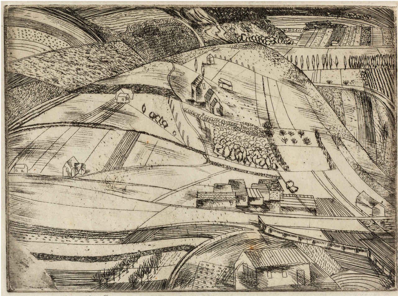
BARCSAY Jenő: Máriaremete (Dombos táj) Máriaremete (Hilly Landscape) 1931 12 × 16 cm rézkarc, papír | etching on paper