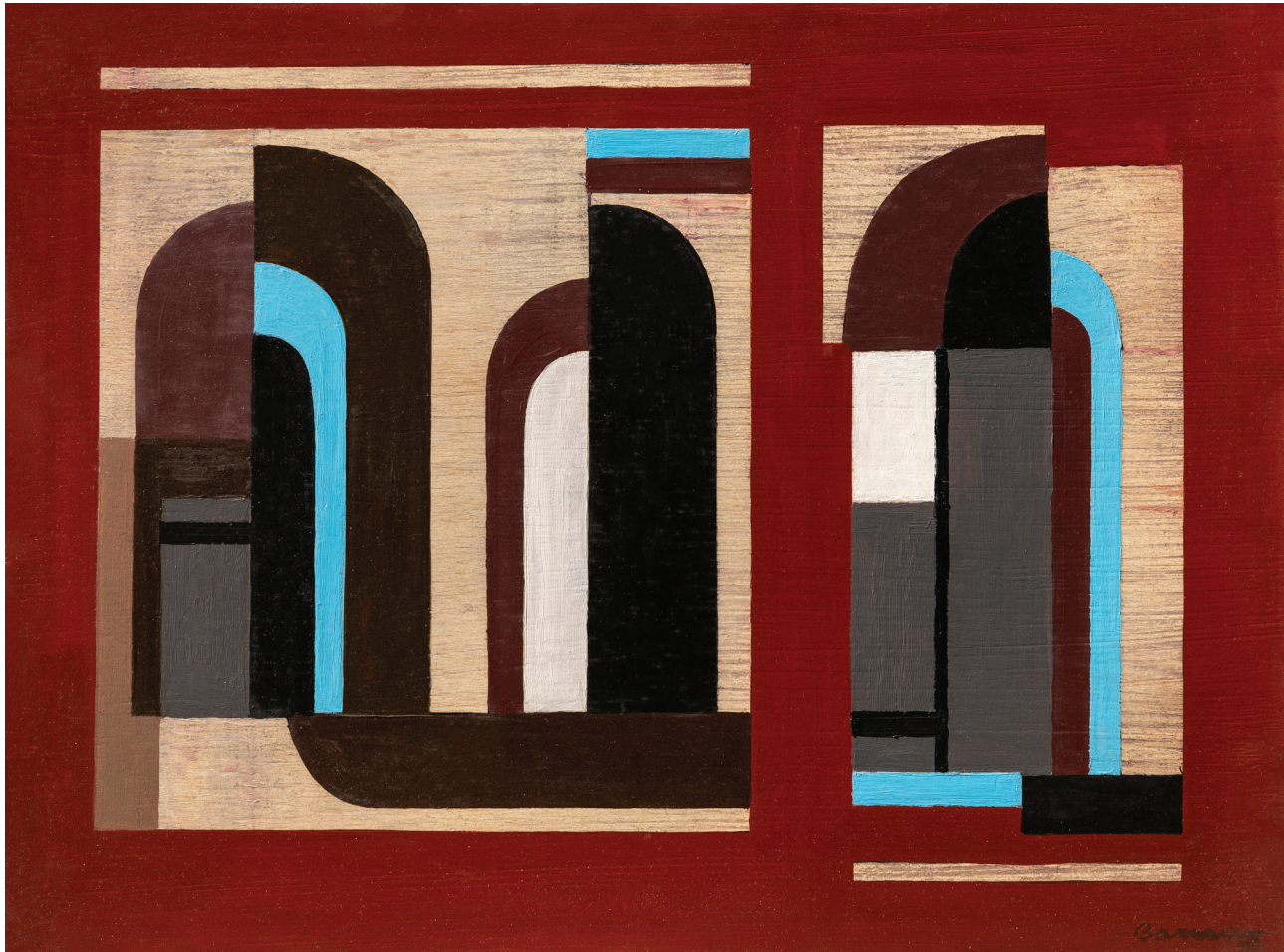
BARCSAY Jenő: Kapuívек pompeii vöröşben Gatehouse Arches in Pompei Red 1971 30 x 40 cm olaj, vászon | oil on canvas