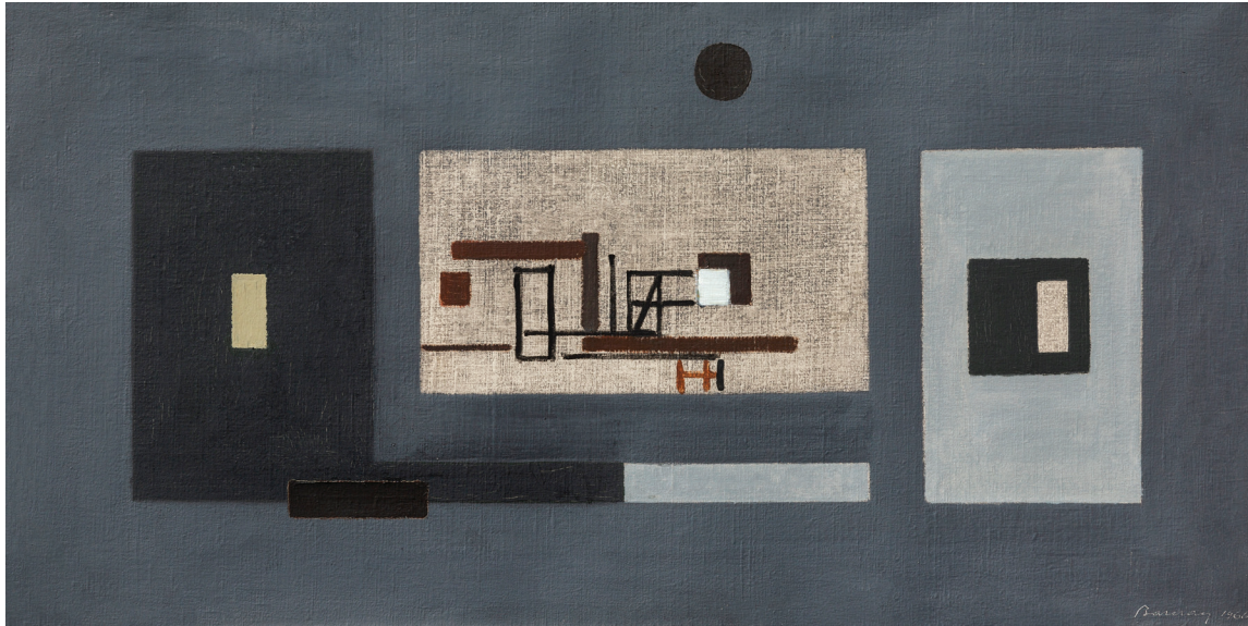
BARCSAY Jenő: Szürke kép | Grey Picture 1966 35 x 70 cm olaj, vászon | oil on canvas

The oeuvre of Jenő Barcsay – one of the most prominent and influential Hungarian painters of the 20 th century whose body of work laid the foundations for a new school of art – is integrally connected to the town of Szentendre. Alongside the classical tradition and modern artistic aspirations, his artistic approach was shaped by his constant experimentation in painting. In 1929, he became a member of the Society of Szentendre Painters and the town's Artists' Colony. The motifs which Barcsay sought as he wandered Szentendre's cobblestoned streets – and which were present throughout his entire body of work – were inspired by the vistas of the town located on the bank