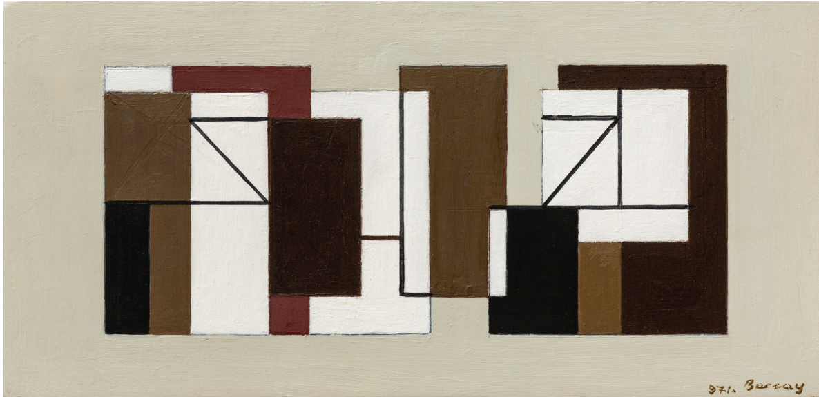
BARCSAY Jenő: Formaritmusok (Kompozíció) Form Rhythms (Composition) 1971 14,5 x 30 cm olaj, vászon | oil on canvas

skills of representing the human figure onto several generations of artists. His volume entitled Anatomy for the Artist has been translated into fifteen languages and remains an authoritative textbook in art education to this day.