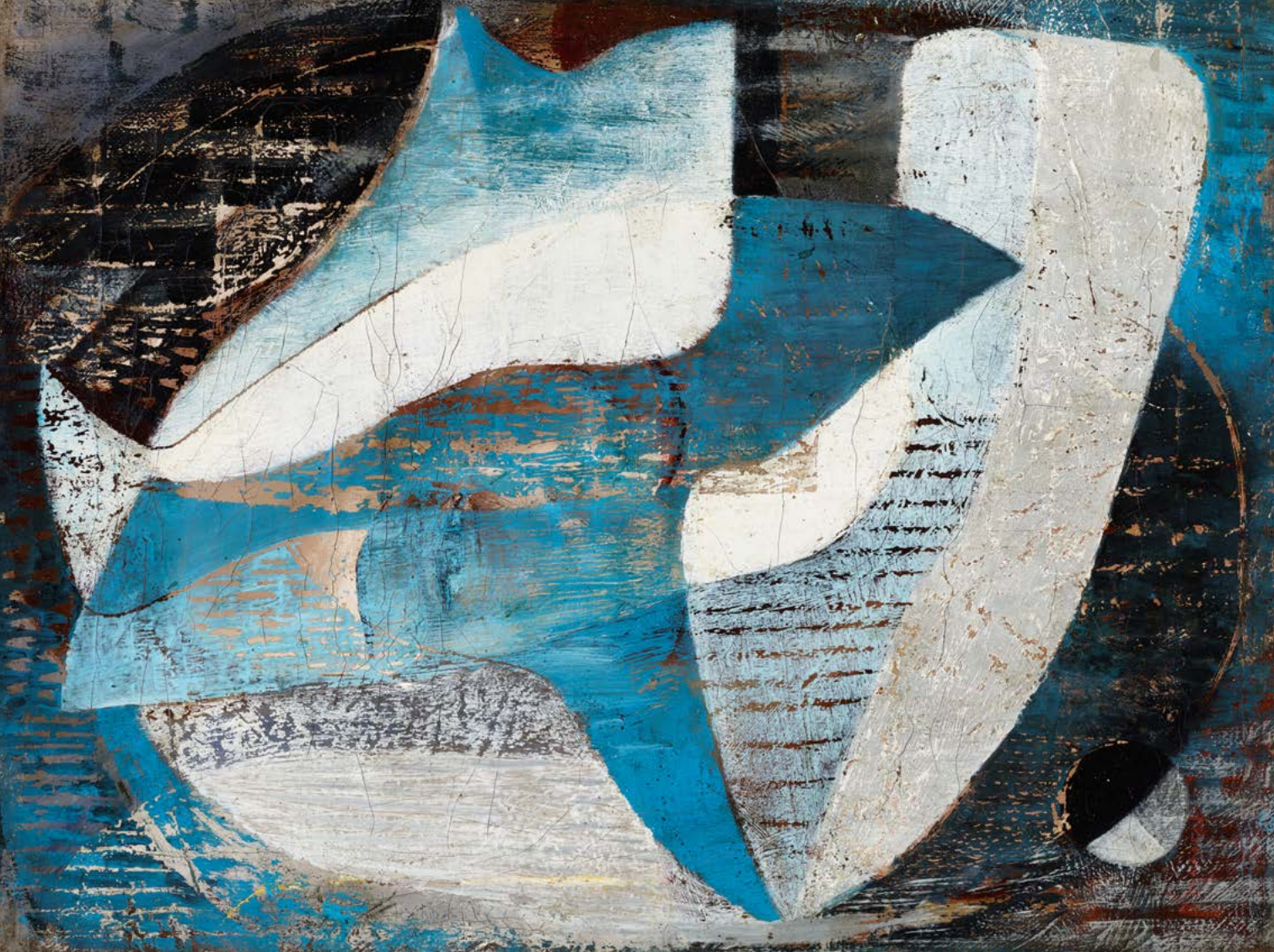
GYARMATHY Tihamér: Kompozíció I. | Composition I, 1945 olaj, vászon | oil on canvas, 30 x 40 cm Janus Pannonius Múzeum, Pécs