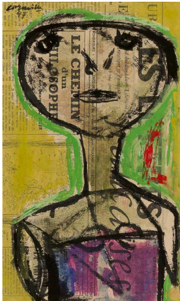
CORNEILLE: A filozófus útja | The Way of the Philosopher, 1947 gouache, tus, papír | gouache and India ink on paper, 342 × 221 mm magántulajdon | private property | korábban a Simonis & Buunk (Ede) gyűjteményében | earlier in the collection of Simonis & Buunk (Ede)

This principle was embraced by Hungarian artists who had found themselves disadvantaged during the interwar period. The European School represented both