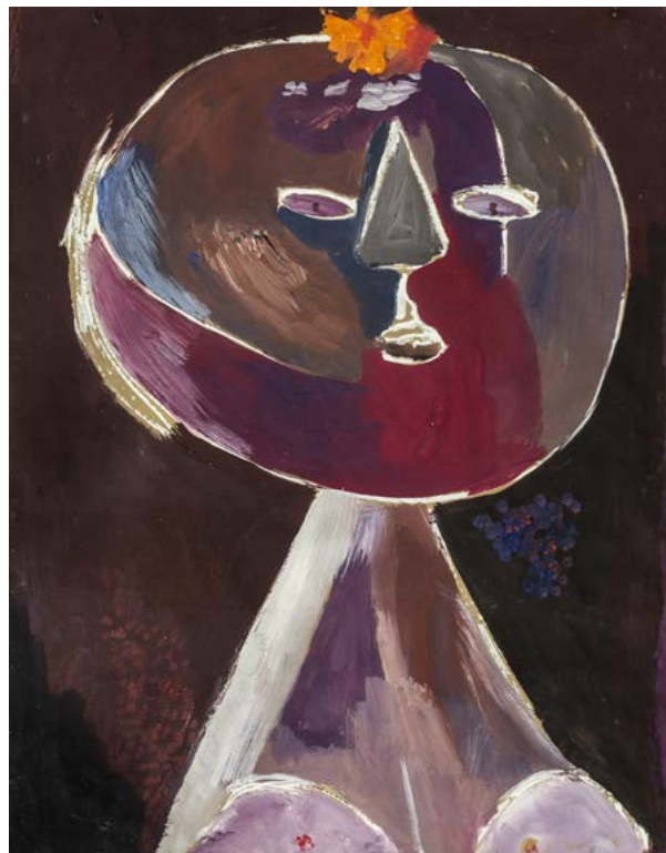
ANNA Margit: Fej | Head, 1946 tempera, papír | tempera on paper, 57,5 x 45 cm Ferenczy Múzeumi Centrum, Szentendre

Ehhez az alapvetéshez csatlakoztak a magyar képzőművészet olyan képviselői, akik a két világháború között az árnyékos oldalra szorultak. Az Európai