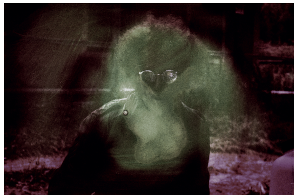
FORGÁCS Péter: Light original Kenedi | Light Original Kenedi, 1974–1985 giclée nyomtat, vászon | giclée print, canvas

A MűvészetMalom kiállítóterében megvalósuló tárlat egyrészt új művészi irányokat és célokat mutat be, másrészt összegzi a művész munkásságának esszenciáját. A kiállítás és a tér elrendezése nem lineáris, a műcsoportokat nem időrendben követi végig a látogató. A nyolc különböző egységet magába ölelő térben az eltérő alkotói korszakok fotói, diaképei, videói és installációi egymásba fonódó szövetet alkotnak. A művész kaleidoszkopszerűen elénk táruló apró megfigyelései elmélyült szemlélődésre hívnak.