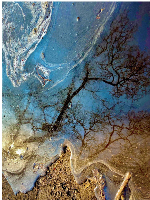
FORGÁCS Péter: Pocsolya sorozat | Puddle series , 2023 giclée nyomtatás, papír | giclée print, paper

In 2007 he received the Dutch Erasmus Prize and in 2008 the Best Experimental Film Prize of the Hungarian Film Week.