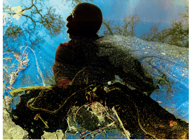
FORGÁCS Péter: Pocsolya sorozat | Puddle series , 2023 giclée nyomtatás, papír | giclée print, paper

altered, distorted and metaphorical. However, through the lens of artistic action, viewers are invited to contemplate elements like the smoke obscuring a face, the rippled surface of a pond, undulating branches, or human silhouettes. These are both objective perceptions and deeply personal experiences, simple phenomena, hidden enigmas, representations, quest for identity, revelations and hiding. Péter Forgács invites us to the labyrinth of artistic self-expression to discover all that seemed conventional for the first time through an exciting and abstract filter.