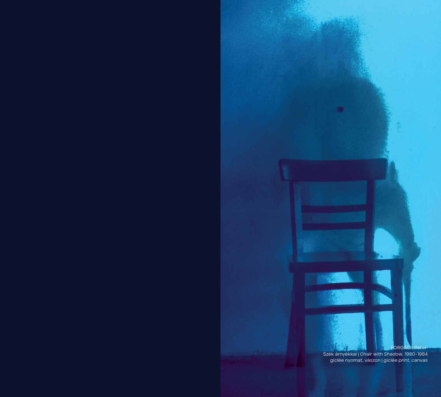
FORGÁCS Péter: Szék árnyékkal | Chair with Shadow , 1980–1984 giclée nyomtatás, vászon | giclée print, canvas