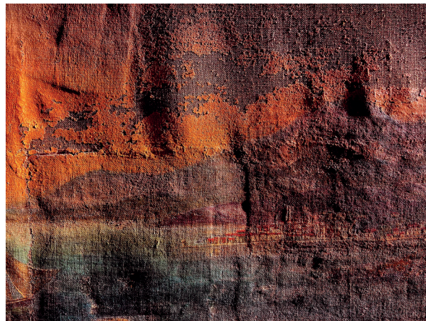
FORGÁCS Péter: Kanavász II. | Canavas II , 2023 giclée nyomat, papír | giclée print, paper

kitárulkozások és elbűjások. Forgács Péter a művészi önkifejezés labirintusába invitál, hogy rácsodálkozhassunk egy rendkívül izgalmas, absztrakt szűrőn keresztül mindarra, ami elsősre konvencionálisnak tűnhet.