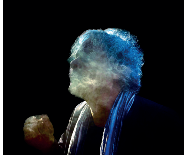
FORGÁCS Péter: Füst és tűz sorozat | Smoke and Fire series , 2023 giclée nyomtatás, papír | giclée print, paper